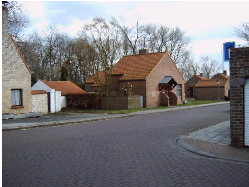
De Stokerij anno 2008